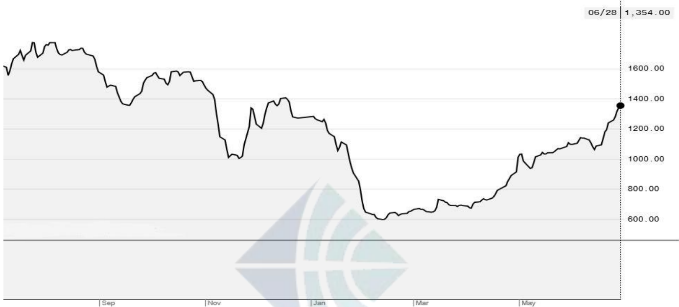
BDI-Dry Market Index (9/01/2018-6/28/2019)