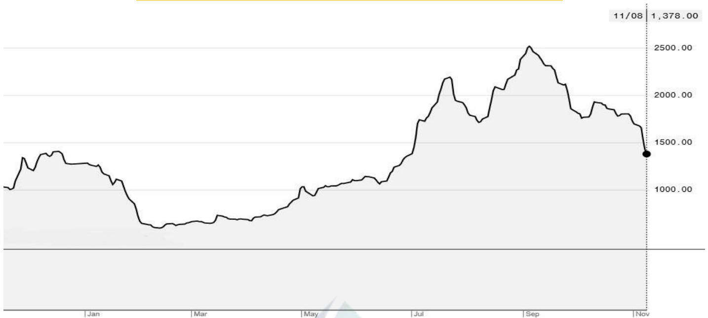
BDI-Dry Market Index (01/01/2019-11/08/2019)