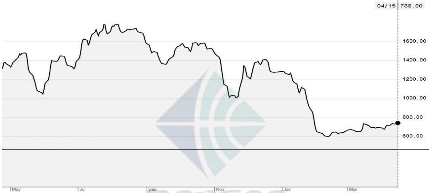
BDI-Dry Market Index (5/01/2018-4/15/2019)