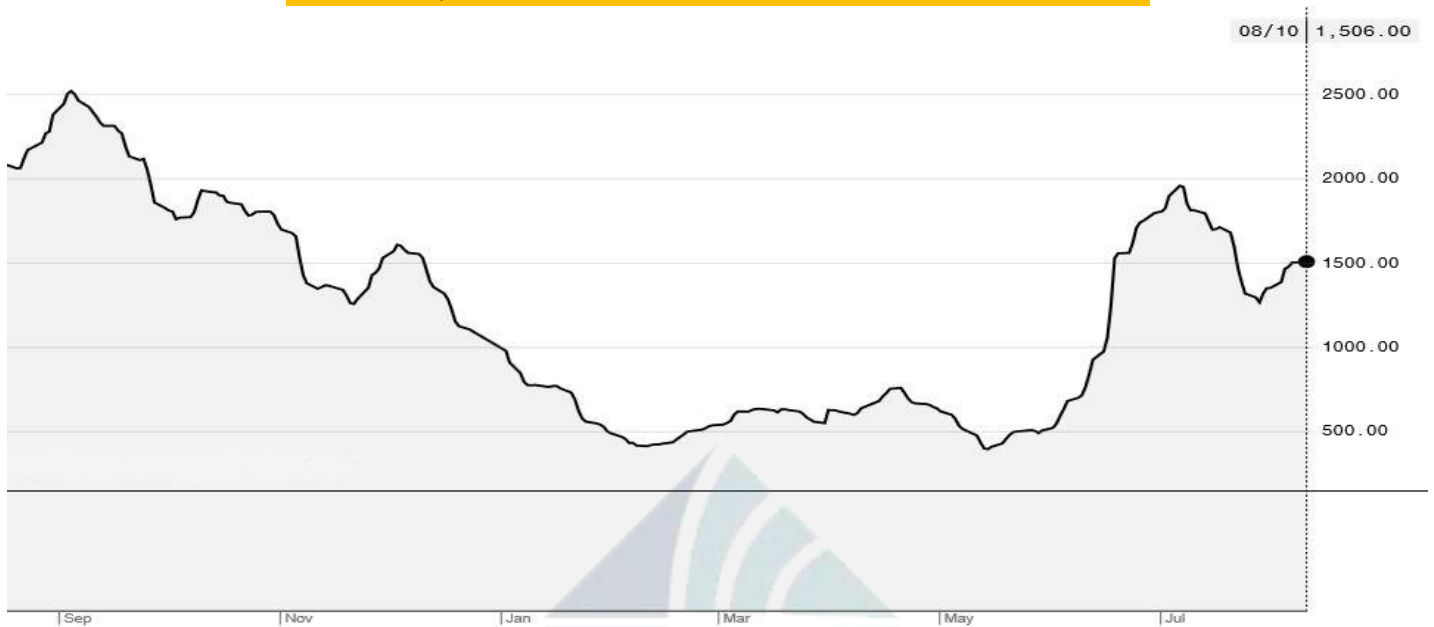
BDI-Dry Market Index (01/09/2019-10/08/2020)