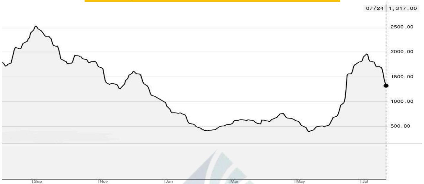
BDI-Dry Market Index (01/09/2019-24/07/2020)