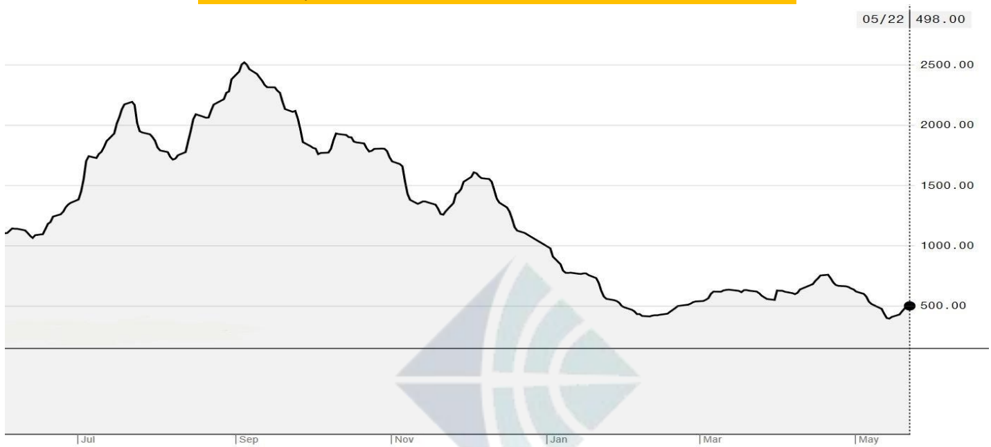
BDI-Dry Market Index (01/07/2019-22/05/2020)