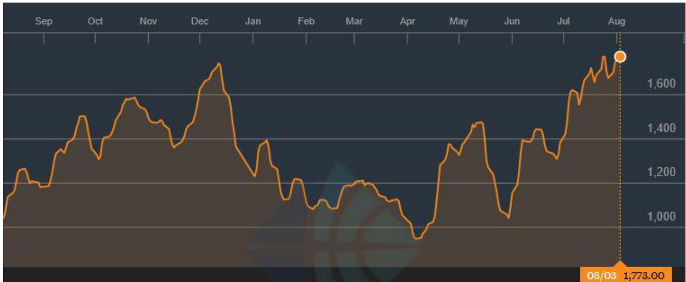
BDI-Dry Market Index (09/01/2017-08/03/2018)