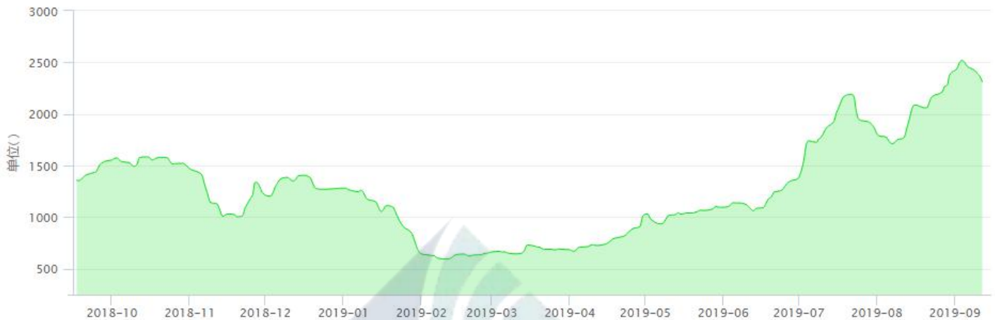
BDI-Dry Market Index (10/01/2018-9/13/2019)