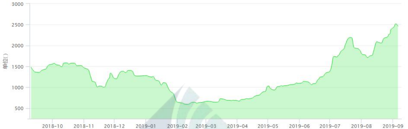
BDI-Dry Market Index (10/01/2018-9/06/2019)